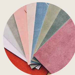
Prijstabel 5 Velvet/velours kaart