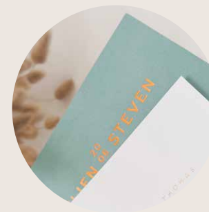
Prijstabel 3 Gekleurde kaart + letterpress