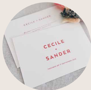
Prijstabel 1 Witte kaart + letterpress