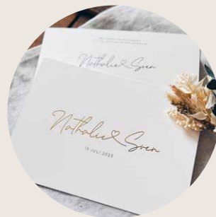
Prijstabel 2 Witte kaart + foliedruk