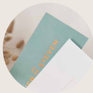
Prijstabel 4 Gekleurde kaart + foliedruk